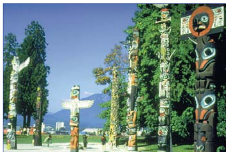
Stanley Park, Vancouver

tragungsort verschiedener Disziplinen während der olympischen Winterspiele. Über den Sky Highway führt die Fahrt am Nachmittag weiter nach Vancouver. F